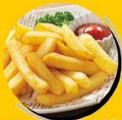
ポテトフライ ¥364 ¥400税込