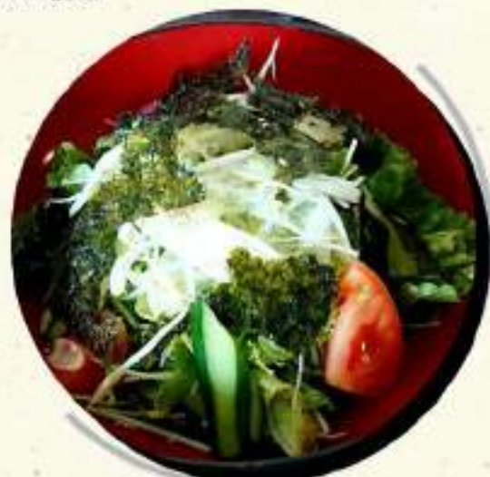
チョレギサラダ ¥573 ¥630税込