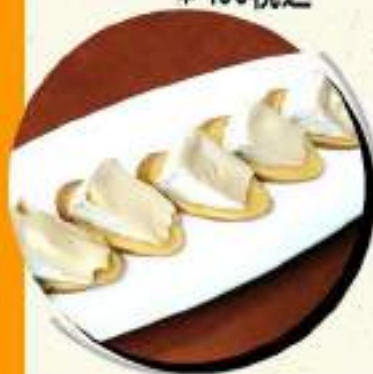
いぶりがっこ ¥709 カマンベールチーズ ¥780税込