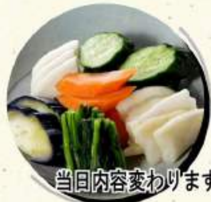
当日内容変わります 自家製 ¥409 漬物盛合せ ¥450税込