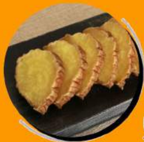
秋田名物 ¥436 いぶりがっこ ¥480税込