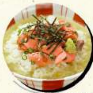
お茶漬け ¥409 鮭・明太子 ¥450税込