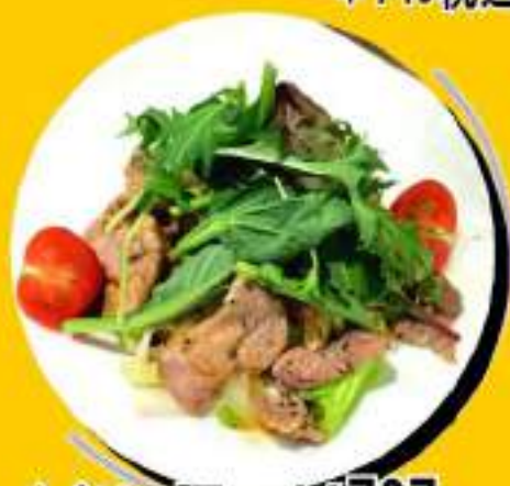
イベリコ豚 ¥727 きのこサラダ ¥800税込