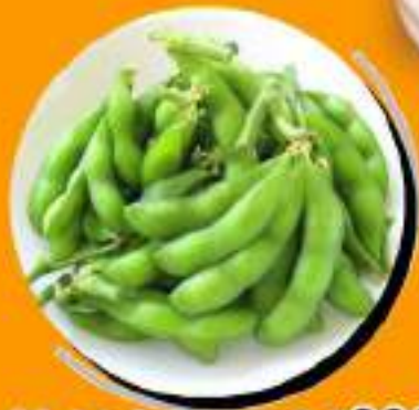
枝付き枝豆 ¥382 ¥420税込