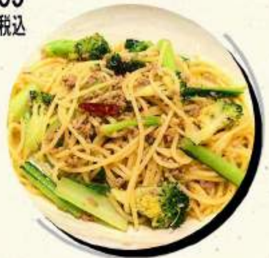
ペペロンチーノ ¥782 ¥860税込