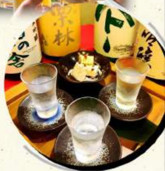
秋田の地酒 ￥1136 飲み比べセット ￥1250税込