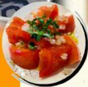
冷トマト ¥409 ¥450税込