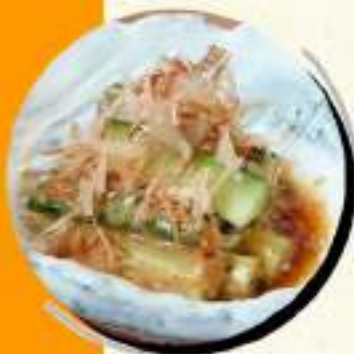
梅きゅ〜 ¥364 ¥400税込