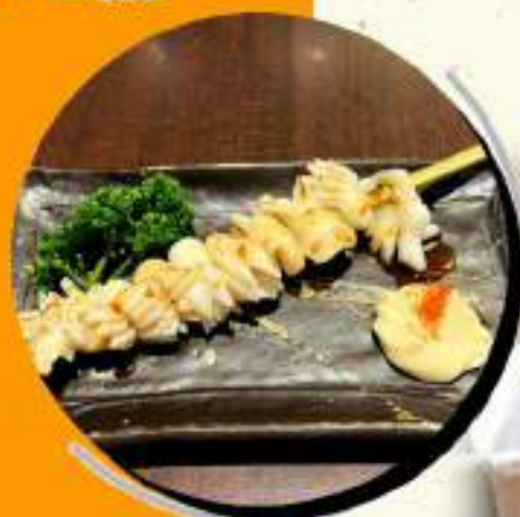
いか串 ￥545 デカいの1本 ￥600税込