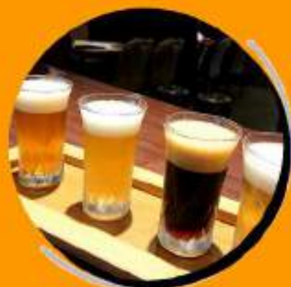
クラフトビール ￥1136 飲み比べセット ￥1250税込