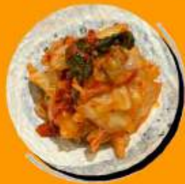
キムチ ¥364 ¥400税込