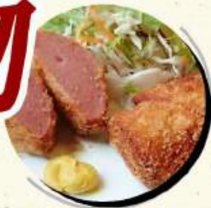
厚切りハムカツ ¥564 ¥620税込