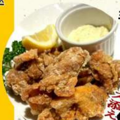
若鶏唐揚 ¥455 ¥500税込