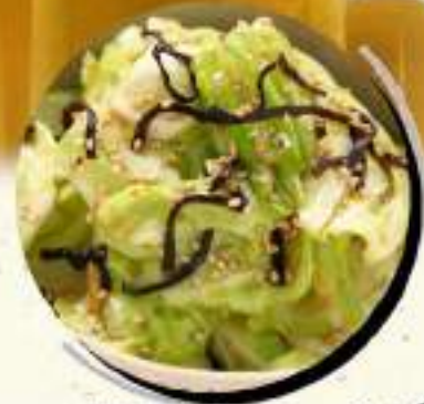
塩昆布 ¥364 キャベツ ¥400税込