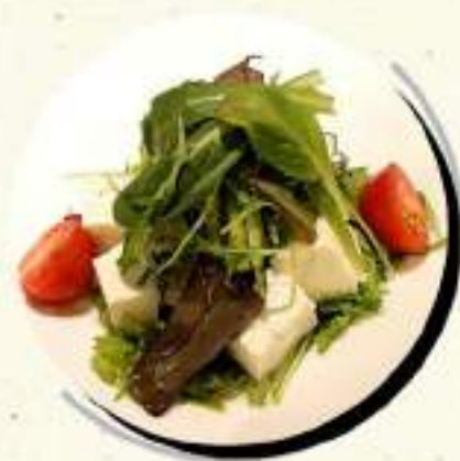
豆腐のサラダ ¥564 ¥620税込