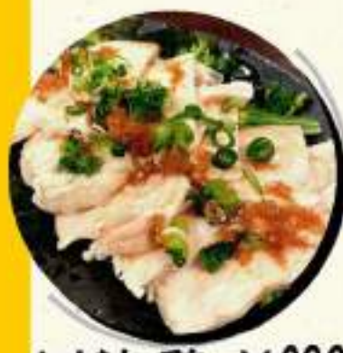
よだれ鶏 ¥636 ¥700税込