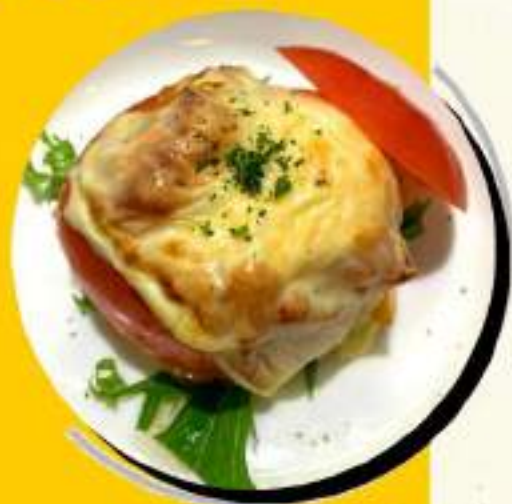
トマトベーコン ¥545 チーズ焼き ¥600税込