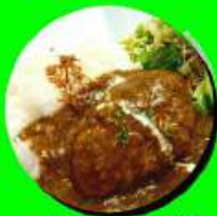
パンパークカレー ¥818 ¥900税込