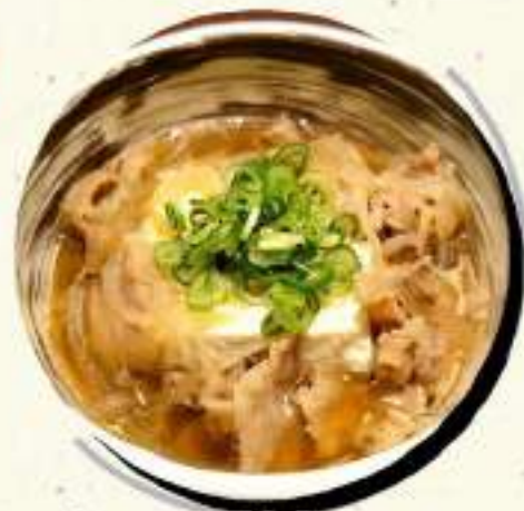
肉豆腐 ￥564 ￥620税込