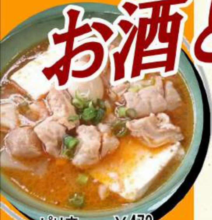
ピリ辛 ￥473 もつ煮込み ￥520税込