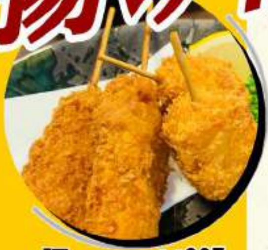
豚串カツ1本 ¥227 ¥250税込