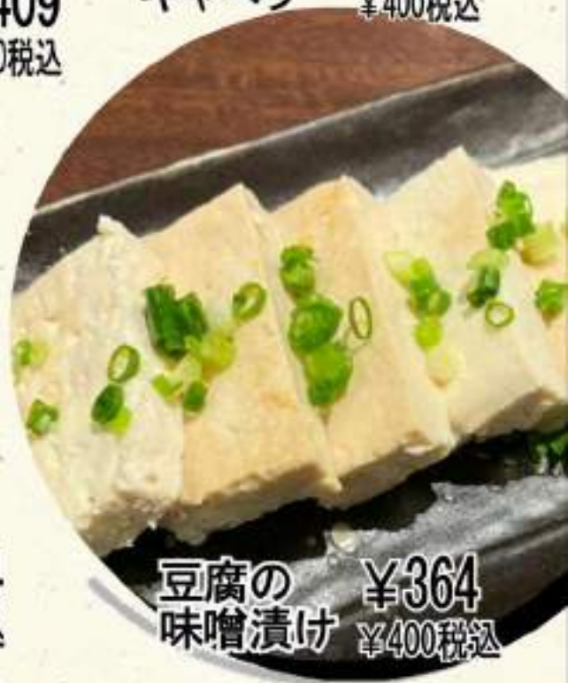
豆腐の ¥364 味噌漬け ¥400税込