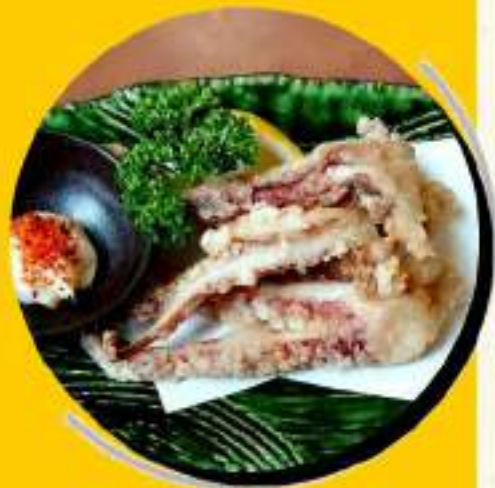
いか下足揚げ ¥473 ¥520税込