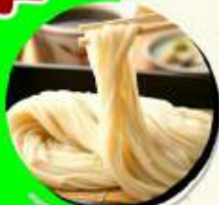
稲庭うどん ¥818 ¥900税込