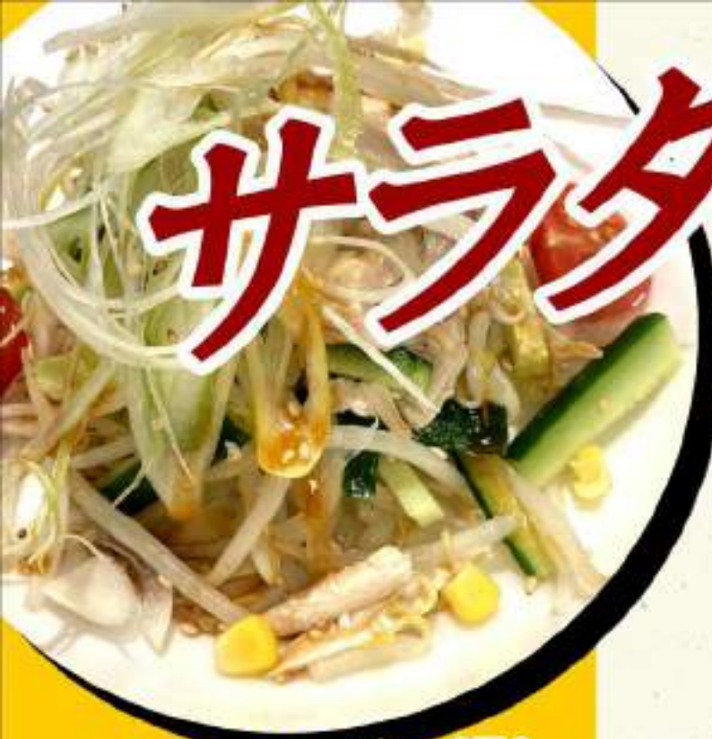
中華風サラダ ¥673 ¥740税込