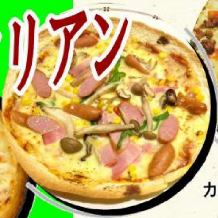
ミックスピザ ¥909 ¥1000税込