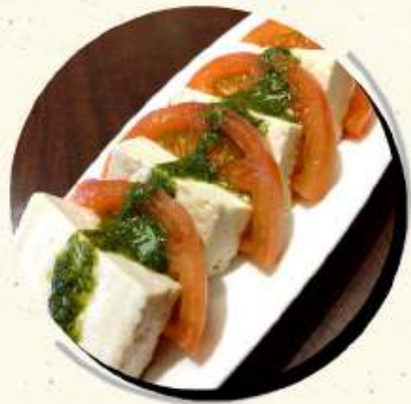
味噌漬豆腐の ¥573 カプレーゼ ¥630税込