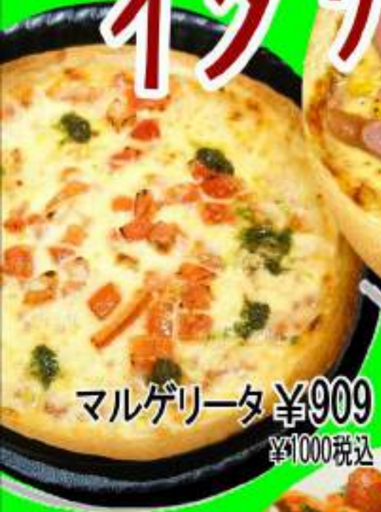
マルゲリータ ¥909 ¥1000税込