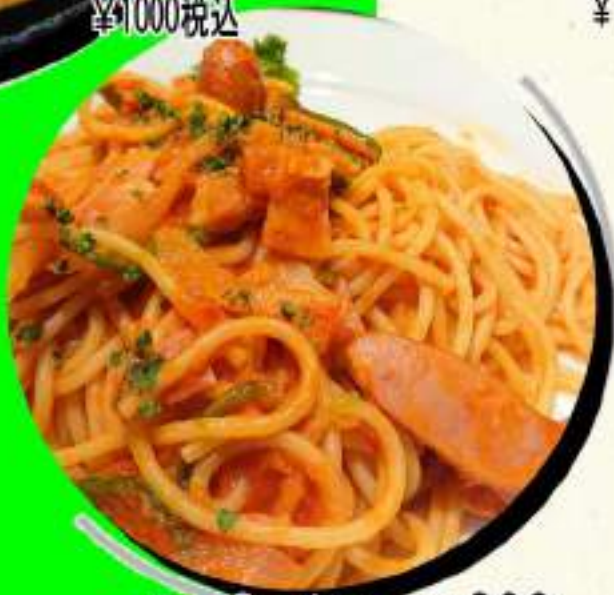
ナポリタン ¥800 ¥880税込