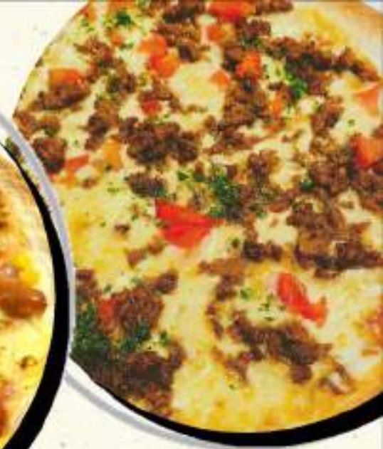
カレーピザ ¥909 ¥1000税込